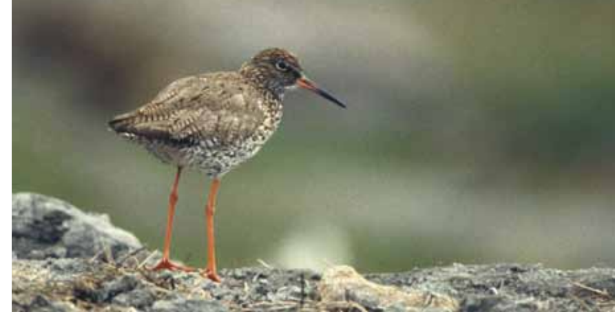
RØDSTILKEN kjennes lett på sine røde bein og klare fløyte-toner.