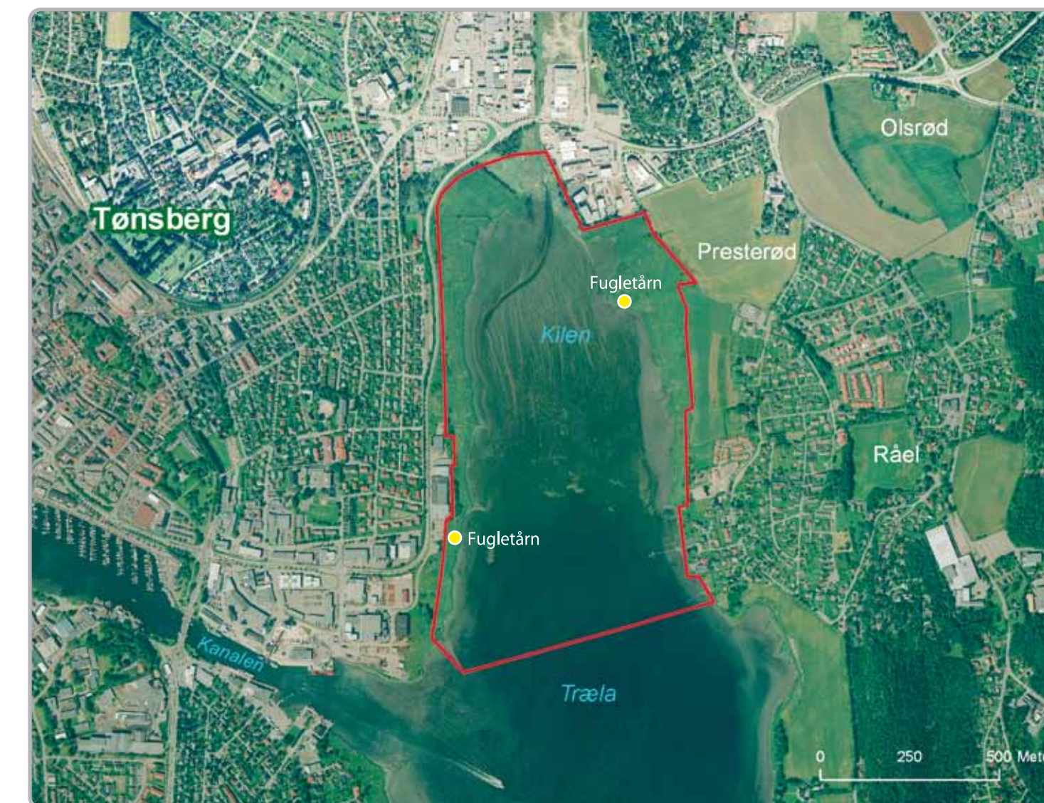
Presterødkilen ligger som en oase for fuglene midt i bylandskapet.

Osebergskipet kan fortelle en historie fra den gang havet sto noen meter høyere. På 800-tallet seilte det inn fjordarmen, der Vellebekken renner i dag, mot sitt siste bestemmelsessted i Slagendalen.