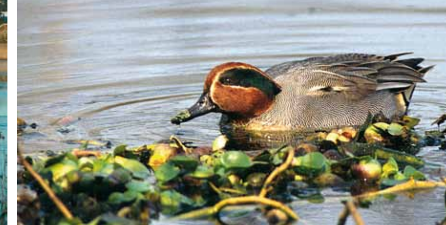
KRIKKAND (hann i vådrakt). Liten and, vanlig på trekk.