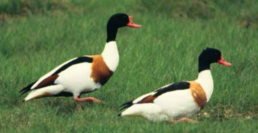
GRAVANDPAR (hunnen først). Karakterfugl på mudderflatene.