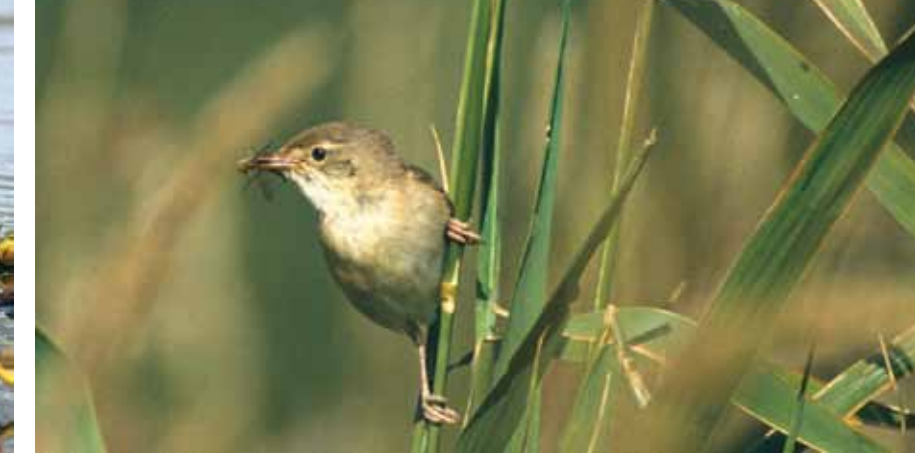
RØRSANGER. Nykommer i norsk fauna, hekker i takrørskogen.